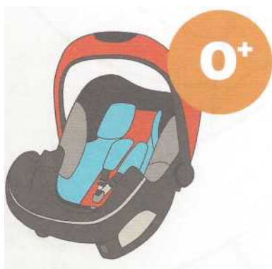
0-13 кг от рождения до 1 года

Покупайте кресло вместе с ребенком. Пусть он попробует посидеть в нем - прямо в магазине.