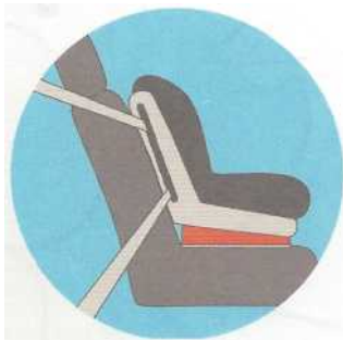
Лицом по ходу движения

Самое безопасное место для установки детского кресла в автомобиле — среднее место на заднем сиденье. Самое небезопасное - переднее пассажирское сиденье. Туда автокресло ставится в крайнем случае, при обязательно отключенной подушке безопасности.