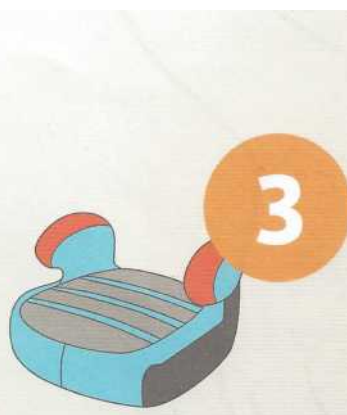
22-36 кг от 6 до 12 лет