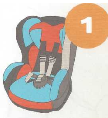
9-18 кг от 9 месяцев до 4 лет