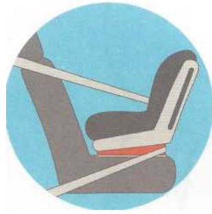
Лицом против движения