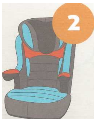
15-25 кг от 3 до 7 лет